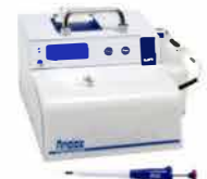
Glucose- Alcohol- Lactate- Analysers