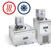
Bad Ciruclatie Thermostaten