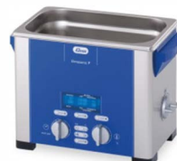
Ultrasoon baden Laboratorium