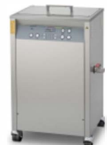
Ultrasoon baden Industrie