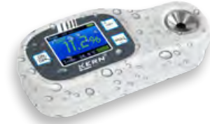
IP65: Protégé contre la poussière et les projections d'eau