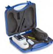
Mallette de rangement