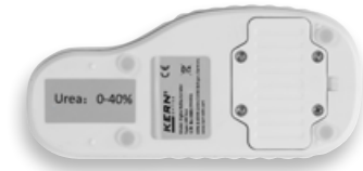
Vue face arrière, couvercle vissé du compartiment des piles